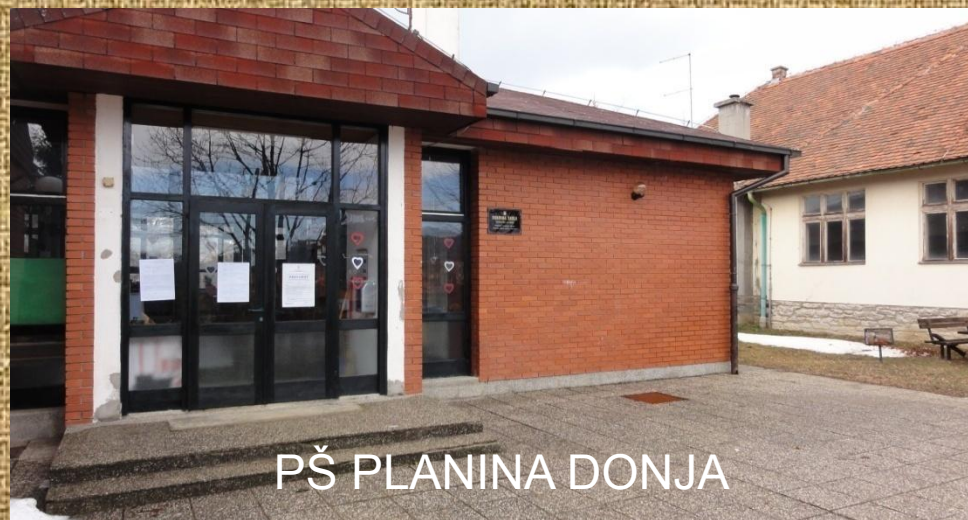
PŠ PLANINA DONJA