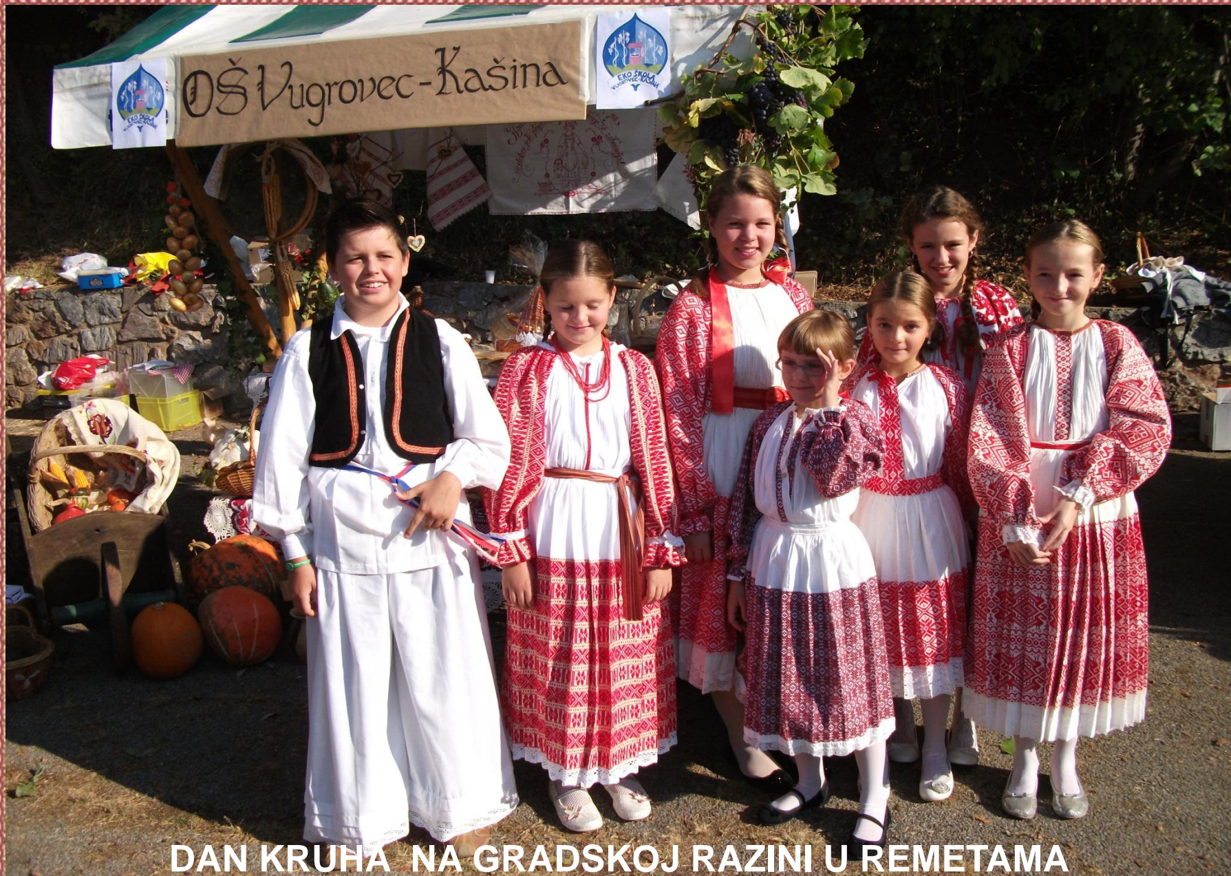
DAN KRUHA NA GRADSKOJ RAZINI U REMETAMA