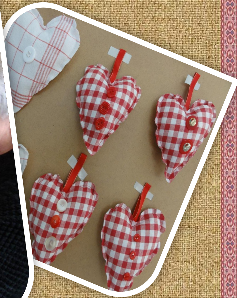
POMOĆ BAKE MARICE